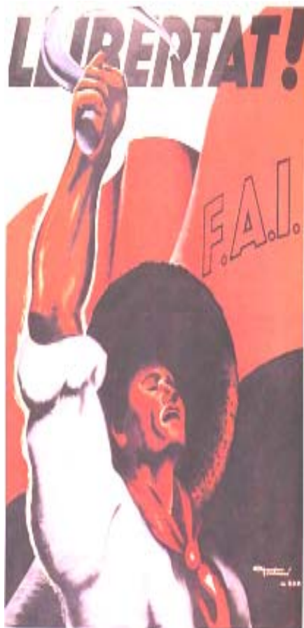
Illustration : Carles Fontseré, 1936.

"Empezar un combate es ya una victoria." B. Durruti